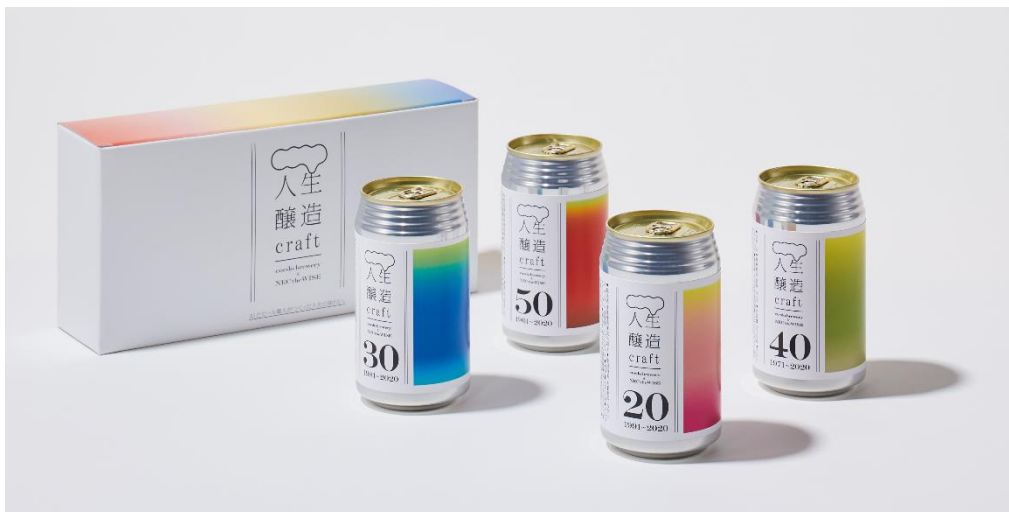
「人生醸造 craft」製品写真

※クラフトビールとは酒税法上、ビールと発泡酒などを指しますが、「人生醸造 craft」にはビールと発泡酒が含まれます。